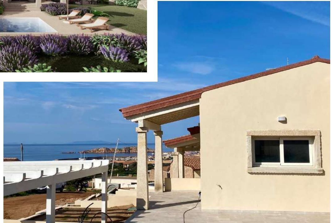
Foto rappresentative dei particolari architettonici delle nostre ville