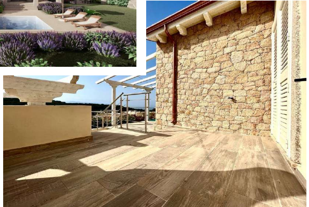
Foto rappresentative dei particolari architettonici delle nostre ville